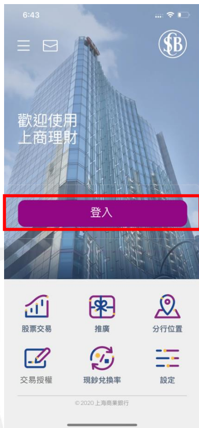
步驟 1 按「登入」