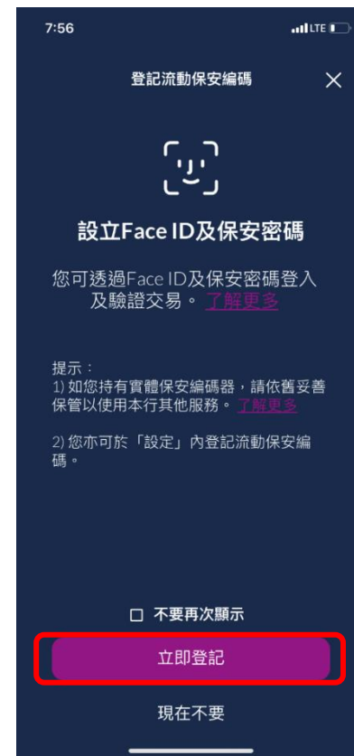
步驟 3 按「立即登記」