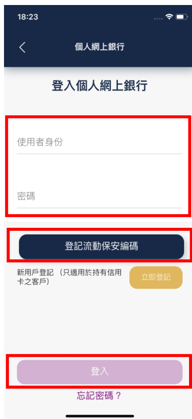
步驟 2 按「登記流動保安編碼」 或直接輸入使用者身份及 密碼 並按登入